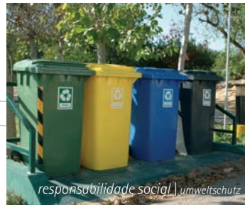
responsabilidade social | umweltschutz