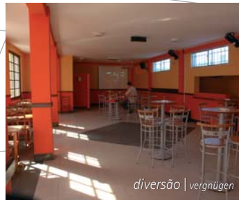
diversão | vergnügen