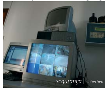
segurança | sicherheit

quartos com wc aquecimento central bungalow restaurante e bar pavilhão multiusos 1000m 2 minimercado campo de futebol relvado parque infantil circuito fechado de tv 8 ecopontos