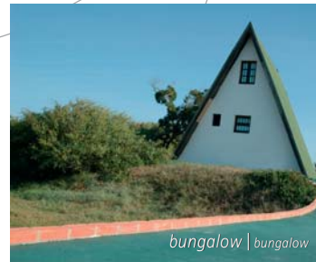
bungalow | bungalow

O camping Costa Nova diferencia-se dos demais pela sua excepcional localização integrada na Reserva Natural, separando o mar e a ria. Os nossos clientes gozam ainda de acesso directo e exclusivo à praia por entre as imensas dunas.