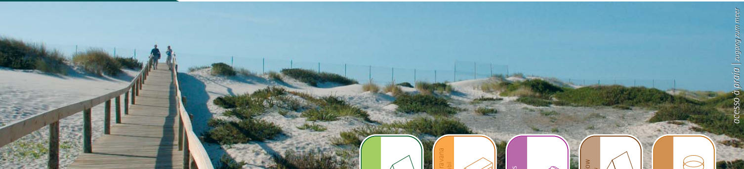
acesso à praia | zugang zum meer

zimmer mit privat wc zentralheizung bungalow restaurant und bar kongresshalle 1000m 2 supermarkt fußball feld kinderspielplatz überwachungssystem 8 ecopunkte